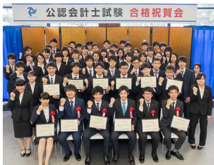
2018 年度 公認会計士合格祝賀会